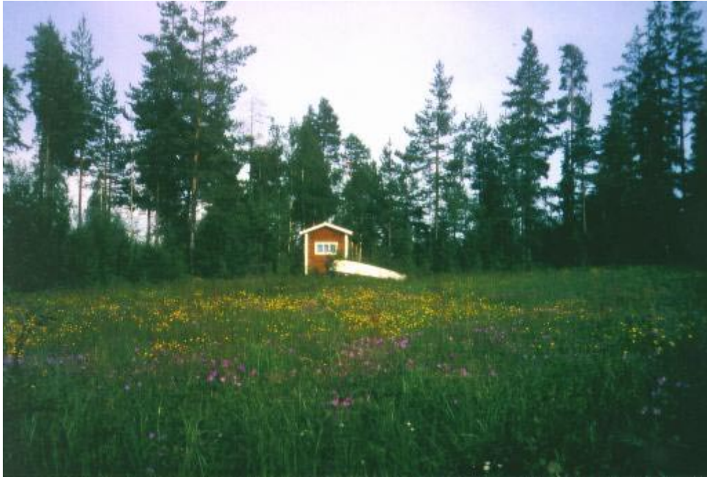
Natur pur - Schweden wie aus dem Bilderbuch